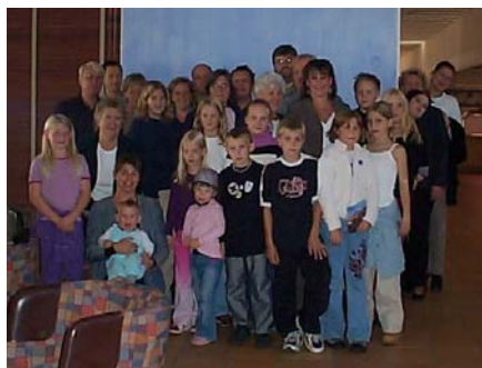
Alla glada deltagare, Höstkonferensen 2002.

ITP-kommittén ordnar varje år kursdagar för ITP:are med familjer. Tanken är att vi ska alternera mellan sommarläger och höstkonferens. Vissa år är det dock inte möjligt att genomföra sommarläger eftersom vi arbetar ideellt och tiden räcker helt enkelt inte till.